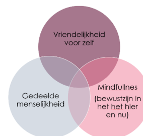
Figuur 1: De elementen voor zelfcompassie

Opdracht: Beschrijf (op schrift of een andere manier) wat naar jouw idee de positie van vakdidactiek is in de les en licht met een voorbeeld toe hoe jij daarmee omgaat.