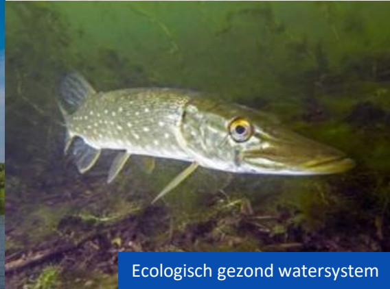
Ecologisch gezond watersysteem